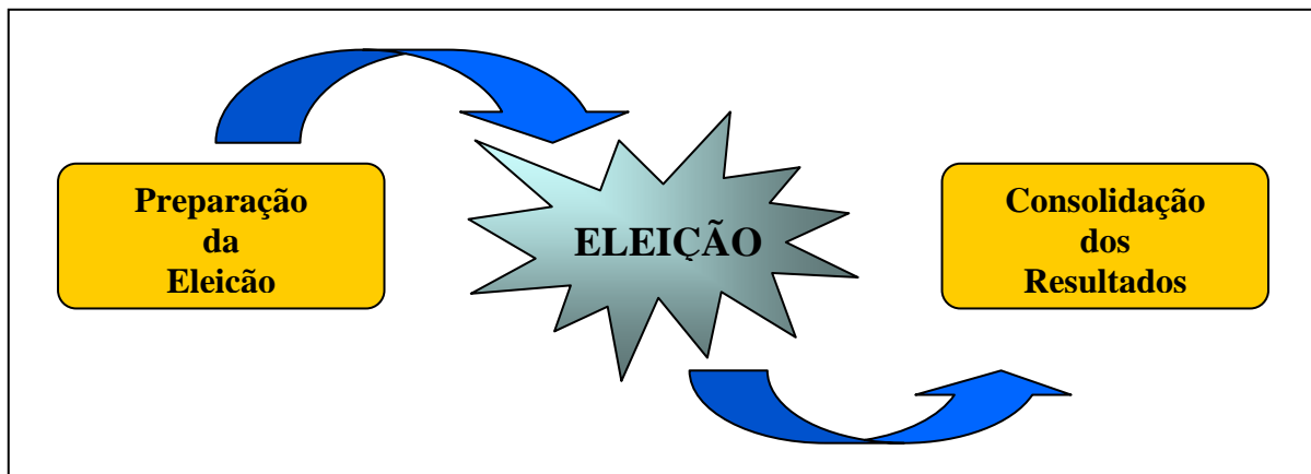
Fig. 1 - Representação do processo eleitoral

Pela sua importância, quer pelo total de pessoas envolvidas, quer pelo âmbito das medidas de segurança que se concentram em um único dia, pode-se dizer que a etapa chamada de eleição é a mais importante.